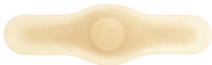
ワンステップ 足の指用