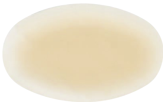
レギュラーサイズ