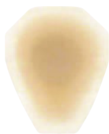
ワンステップ 指の間用